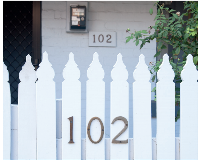
ډاډ تر لاسه کړئ چې ستاسي د کور شمیره په واضح ډول د سړک څخه ښکاري.