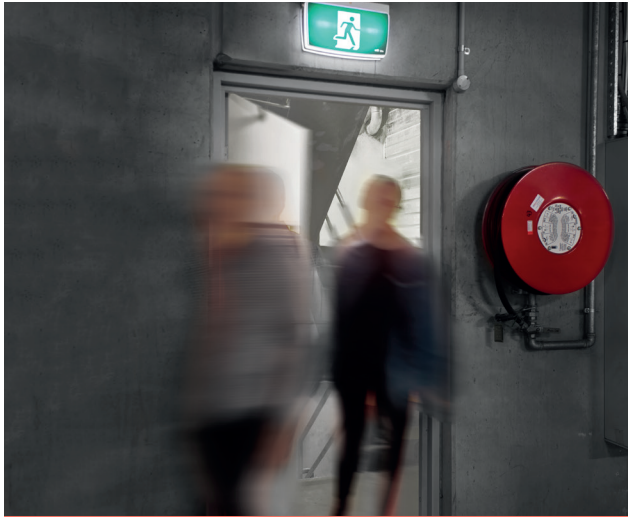
که تاسي په لور پوره ودانۍ کې ژوند کوئ، او پوهیږئ چې اور چرته دي، او تل له زینو له لارې راوځئ.