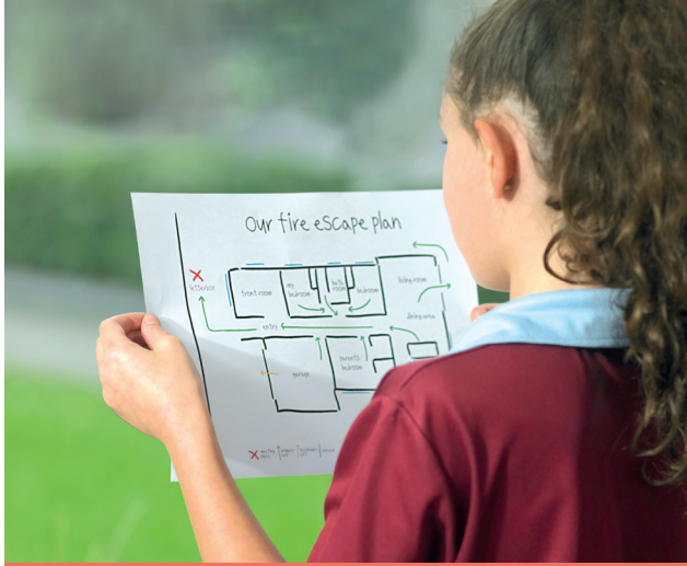
د کور د اور وژني پلان شوی او عملی شوی پلان کولی شي ستاسي ژوند خوندي کړي ، 19مه پاڼه وگورئ.